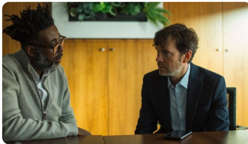
Rispondere con empatia