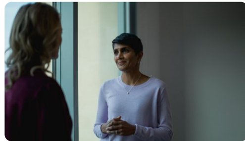
Indirizzare le vittime sopravvissute a un supporto specialistico

*promossa dall'Organizzazione Mondiale della Sanità e da UN Women come approccio pratico e strutturato per affrontare la violenza domestica e sessuale, adattabile a diversi ambienti di lavoro.