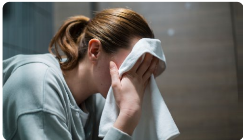
Riconoscere i segnali